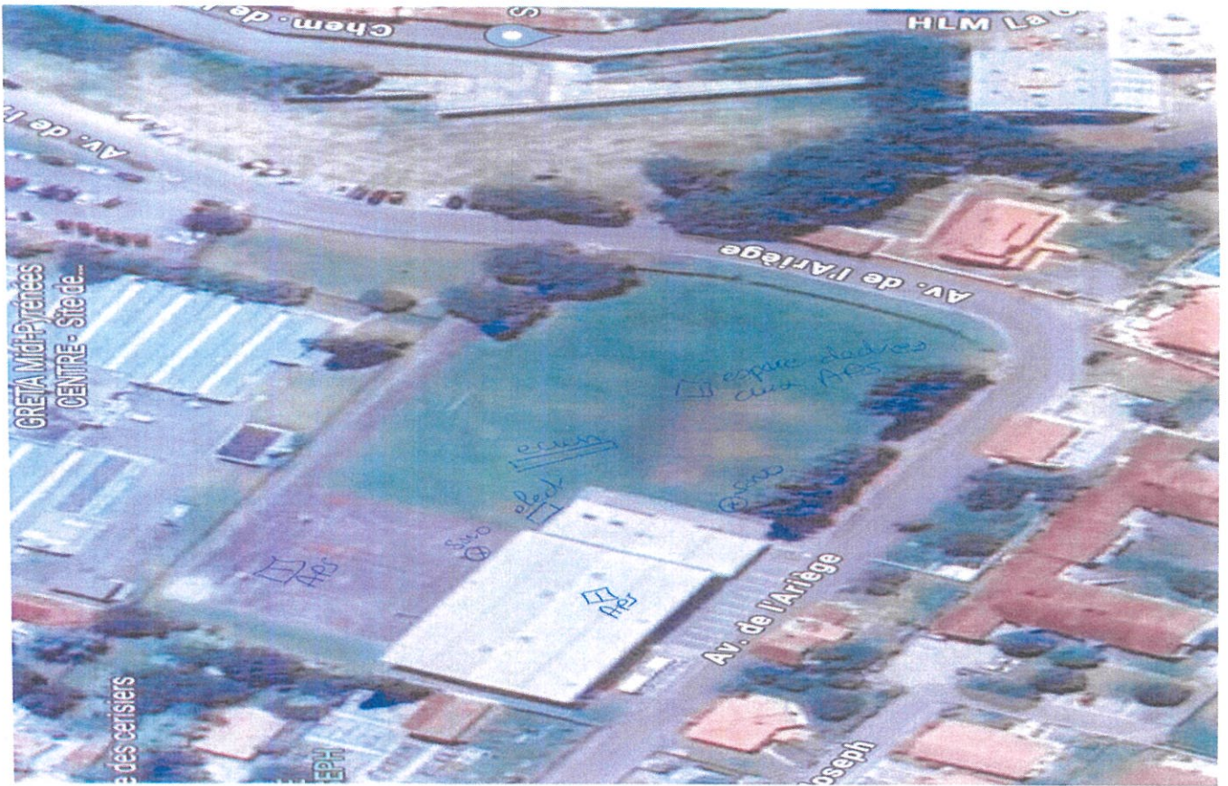
Annexe 4 : stade de la Châtaigneraie