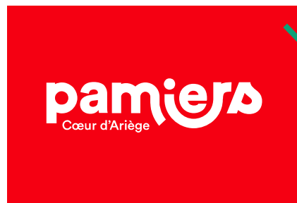
sur un aplat coloré autre que les couleurs de charte