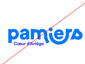
changement des couleurs