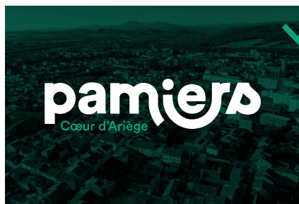
sur fond photo foncé