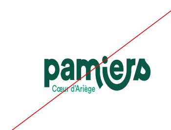
compresser / étirer le logo