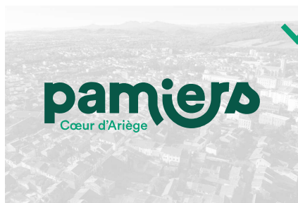
sur fond photo clair

L'identité graphique peut vivre sur des fonds photos ou des fonds colorés à condition de suivre ces quelques règles.